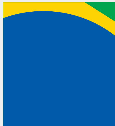
Recorte da bandeira