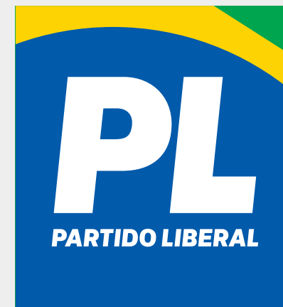
Marca do Partido Liberal