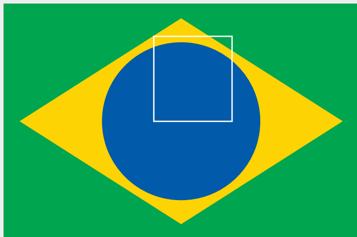
Bandeira do Brasil

A marca do Partido Liberal foi inspirada num recorte da bandeira do Brasil estilizada. O verde e o amarelo da bandeira nacional, agora se destacam na imensidão azul que remete à história do partido. Nesse redesenho, a sigla e a nomenclatura se uniram dentro de parte da esfera azul celeste da bandeira, onde implicitamente representam a ordem, o progresso e a paz.